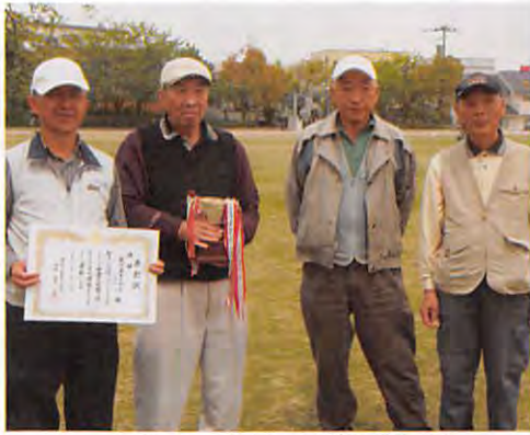
六年ぶり二回目の優勝を果たした新保本第二町会Aチーム

六年ぶりに二回目の優勝をする事が出来ました。メンバー四人は六年前と同じで、平均年齢は七十七・五歳になりました。次回優勝するときは八〇歳を超える計算になります。メンバーは四人とも校区のグラウンドゴルフクラブの会員です。校区には二つのクラブがありますが、各クラブの練習は週に六日、一回約二時間から三時間。雨のふらないかぎり、暑さ寒さをもとめせず、ボールを追いかけ楽しく練習しています。会員の中には各地の大会に参加