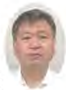
校下の防災訓練について

私は脳卒中リハビリテーション看護師として活動を始め12年目になります。看護師への指導・相談を行う以外に、公民館や地域サロンなどのコミュニティにおいて「脳卒中を予防するための日常生活」や「介護の工夫」などの講演を行い、脳卒中を発症する人が減少するための活動を行っています。今年健康推進委員長という立場で委員の方々と、西南部校下の皆様の健康寿命が延伸できるよう邁進してまいりますので、「ヘルスアップ教室」「親子でラジオ体操」「公民館文化祭」にご参加下さいますよう、よろしくお願いたします。