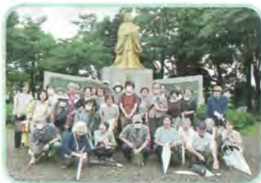
すこやか学級・紫式部公園