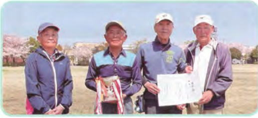
優勝チーム：西金沢3丁目町会