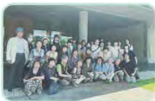
SDGs学級・水墨美術館

ヘルスアップ教室では、保健師さんから健康講話を聞き、スカットボールで親睦を深めました。