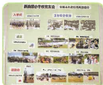
小学校教育友会活動報告