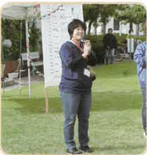
閉会：高堂文化教養副部長