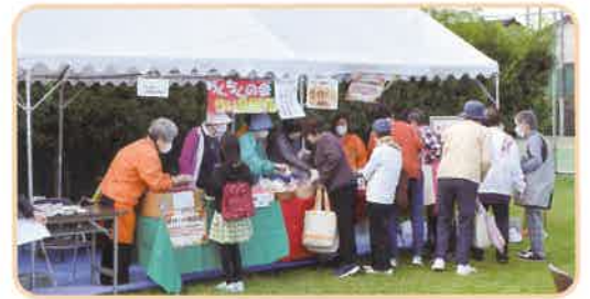
民協の手作り小物は人気です