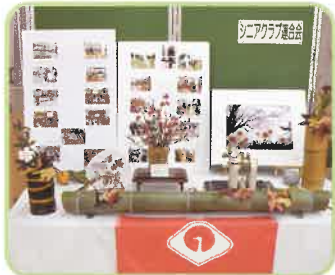
シニアクラブ連合会