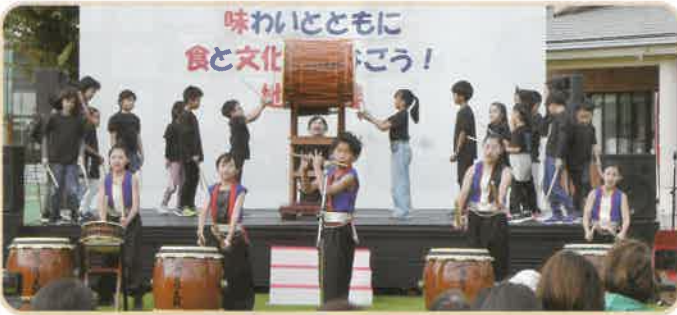
児童館・和太鼓教室