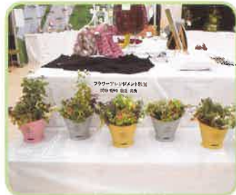
フラワーアレンジメント教室