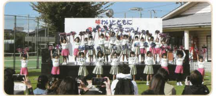
児童館・チアダンス教室