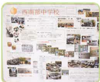
西南部中学校活動報告