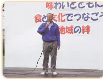
開会：館長あいさつ