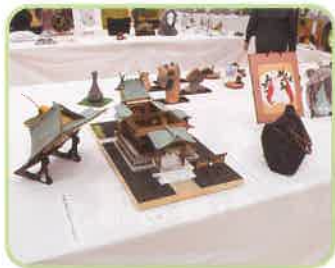
西金沢八幡神社模型