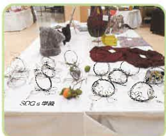
SDGs 学級 ワイヤーアート