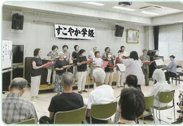
すこやか学級 合唱

また4月に募集を開始します。地域の皆さんとつながりを持つ良い機会になります。関心のある方は是非ご参加ください。