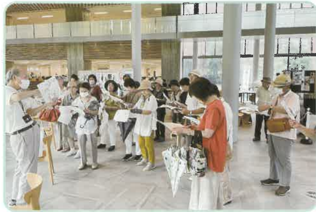
ぶんか学級 牡猫館跡を訪ねて