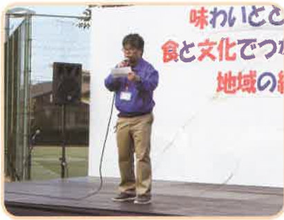
開会スタッフへ：小荒文化教養部長