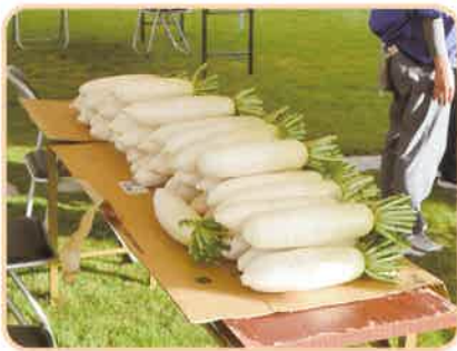
青空市 大根も並びました