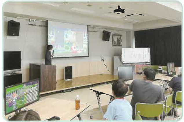
SDGs学級 e-スポーツ体験