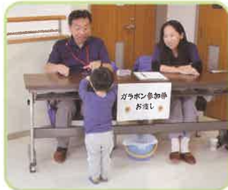
ガラポン抽選券配布