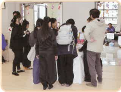
作品展・重さ当て