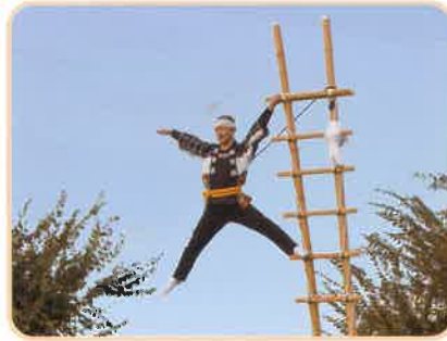
加賀鷹梯子のぼり